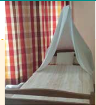
Feuchter Himmel

Die Dehydrierung führt allgemein zu einer Austrocknung der Schleimhäute, nicht nur im Mund-/Rachenraum. Zur Erhöhung der Luftfeuchtigkeit empfehlen sich geräuscharme Luftbefeuchter oder ein sogenannter „feuchter Himmel“ (aus feuchten Bettlaken oder Tischdecken, die über dem Aufrichter aufgehängt werden, s. Foto 3).