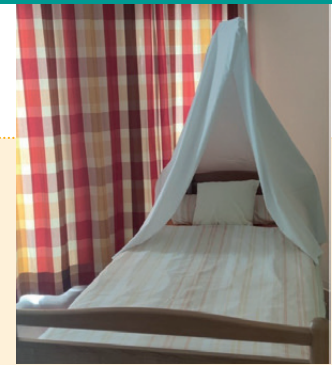
Feuchter Himmel

Die Dehydrierung führt allgemein zu einer Austrocknung der Schleimhäute, nicht nur im Mund-/Rachenraum. Zur Erhöhung der Luftfeuchtigkeit empfehlen sich geräuscharme Luftbefeuchter oder ein sogenannter „feuchter Himmel“ (aus feuchten Bettlaken oder Tischdecken, die über dem Aufrichter aufgehängt werden, s. Foto 3).