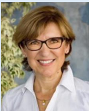
Jentschke_E[ AT ]ukw.de